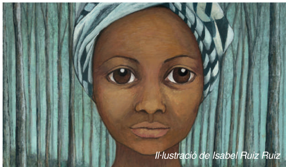
Il·lustració de Isabel Ruiz Ruiz

— Wangari Muta Maathai — Unbowed , pp. 137—