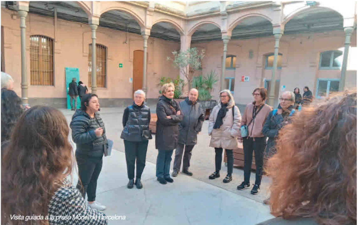
Visita guiada a la presó Model de Barcelona

Les dones preses, sempre han sigut les grans oblidades. Si ja no sabem que passa a les presons en general, en les de dones, encara menys.