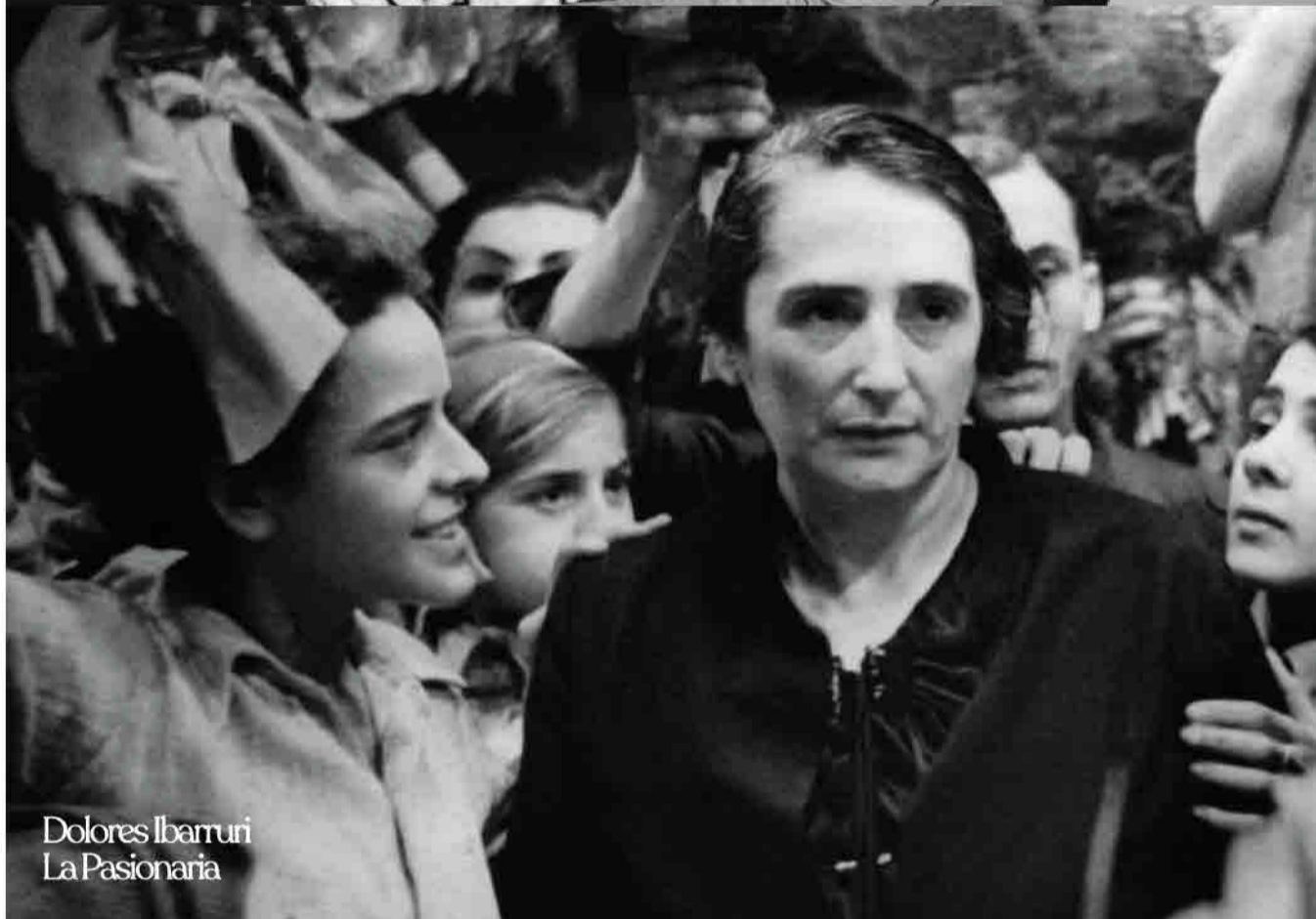
Dolores Ibaruri La Pasionaria